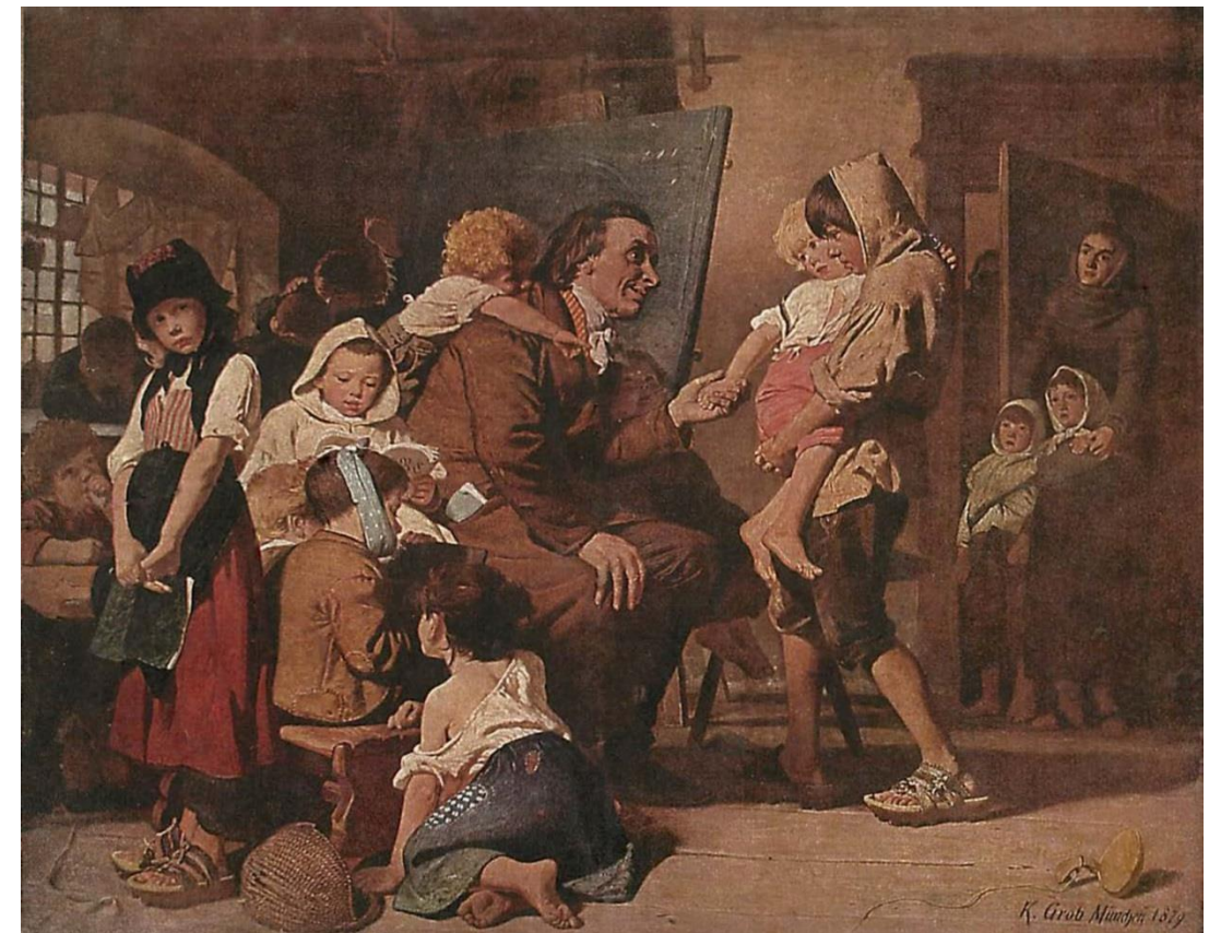
Konrad Grob - Pestalozzi bei den Waisenkindern in Stans.

日時：平成27年3月5日(木) 13:00~19:00 場所：第Ⅰ部 筑波大学 大学会館 国際会議室 第Ⅱ部 筑波大学 大学会館 レストランプラザ